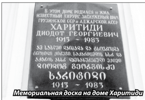
Мемориальная доска на доме Харитиди